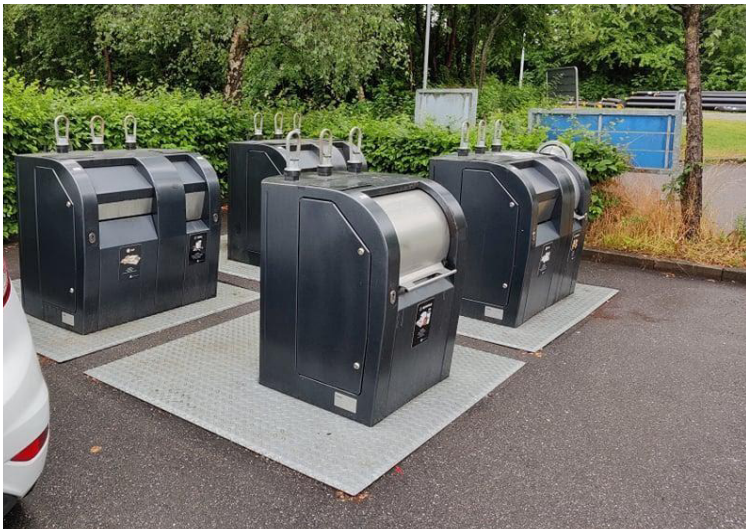
Fuldt nedgravede beholdere