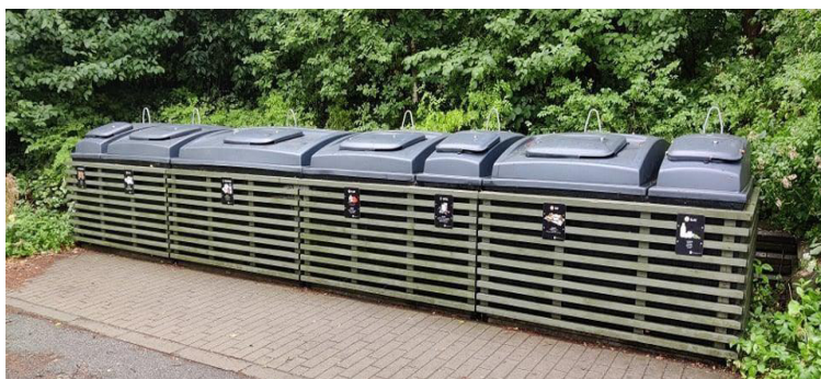
Delvist nedgravede beholdere

De er dyre at etablere, og lidt dyrere at få tømt end minicontainere. Til gengæld er de kønne, fylder ikke helt så meget, og nogle af fraktionerne behøver ikke at blive tømt så ofte, som ved minicontainer-ordningen. Der er færre lugtgener end ved minicontainerne, da størstedelen af affaldet ligger under jordoverfladen, men det er ikke sådan, at de overhovedet ikke lugter.